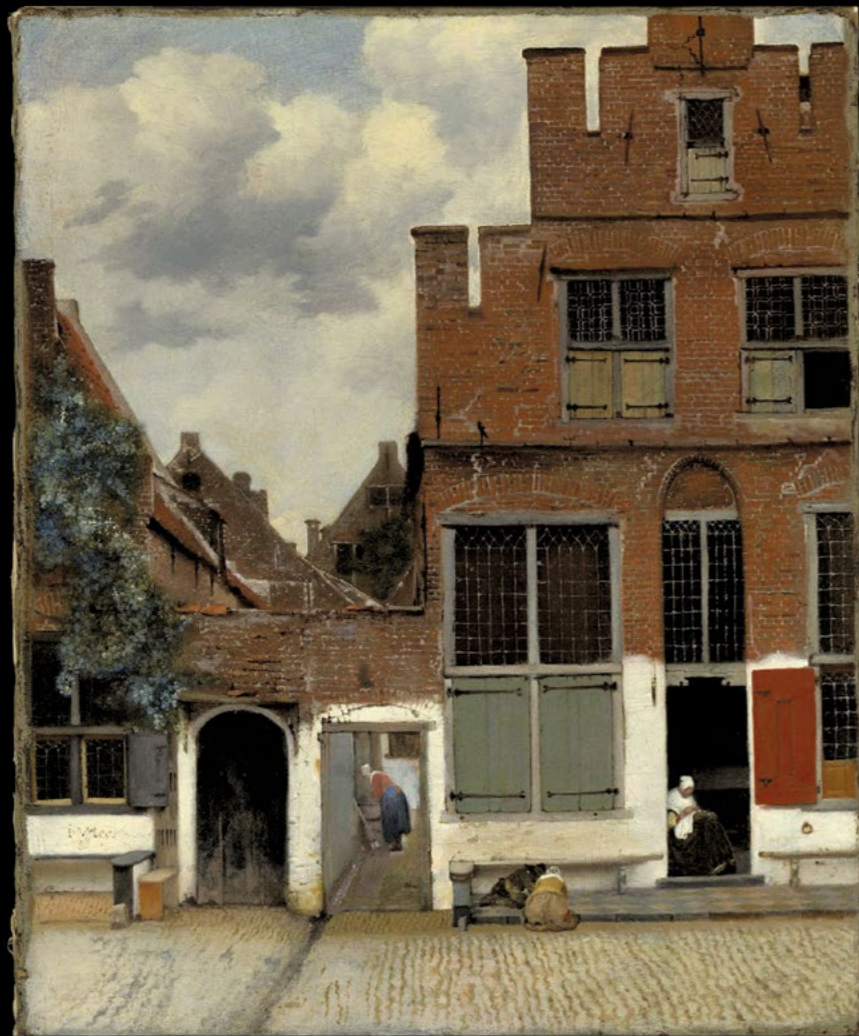
STRASSE IN DELFT (ca. 1658–1660)

Charakteristika besonders auf: Abhängig von der Position im dargestellten Raum erscheinen Konturen der Gegenstände scharfkantig oder weich, werden Oberflächen aus körnigen, später mehr punktuellen oder mosaikartigen Flecken zusammengestellt.