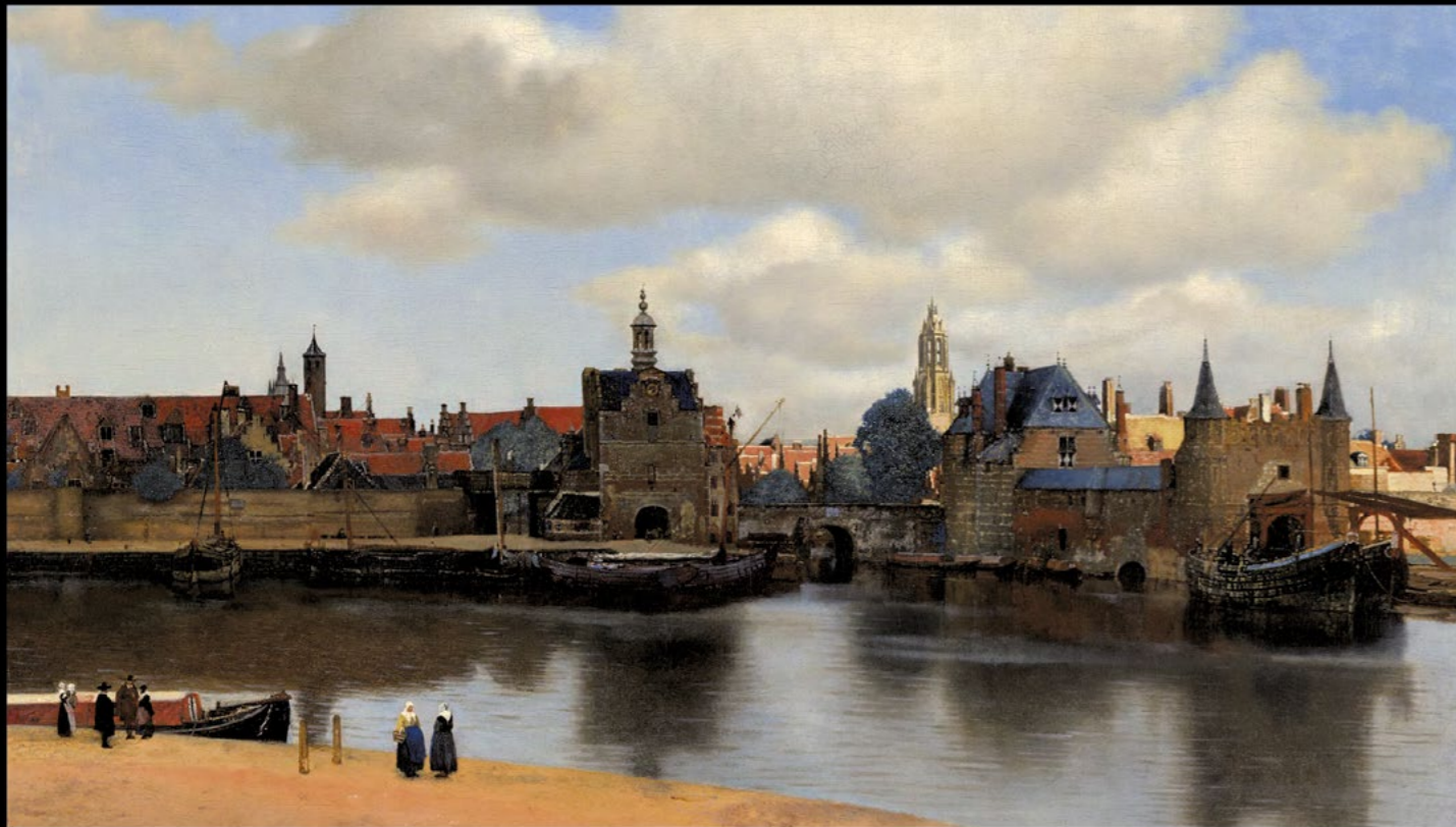
ANSICHT VON DELFT (ca. 1660–1661)

die Grenze von innen nach außen überspielen kann. Eine Ahnung der Außenwelt tritt in die beschützende Welt der Interieurs ein, wenn Vermeer den Blick aus den Fenstern lenkt oder mit Briefen die ferne Welt thematisiert. Es kann sogar die ganze Welt in den begrenzten Bereich seiner Innenräume eindringen, wenn er mit dem Astronom und dem Geographen Himmel und Erde bemüht. Auf einer Reihe von Gemälden zeigt er nachdenkliche, nach innen gekehrte Figuren, die auf tiefere, seelische Reflexionen schließen lassen.