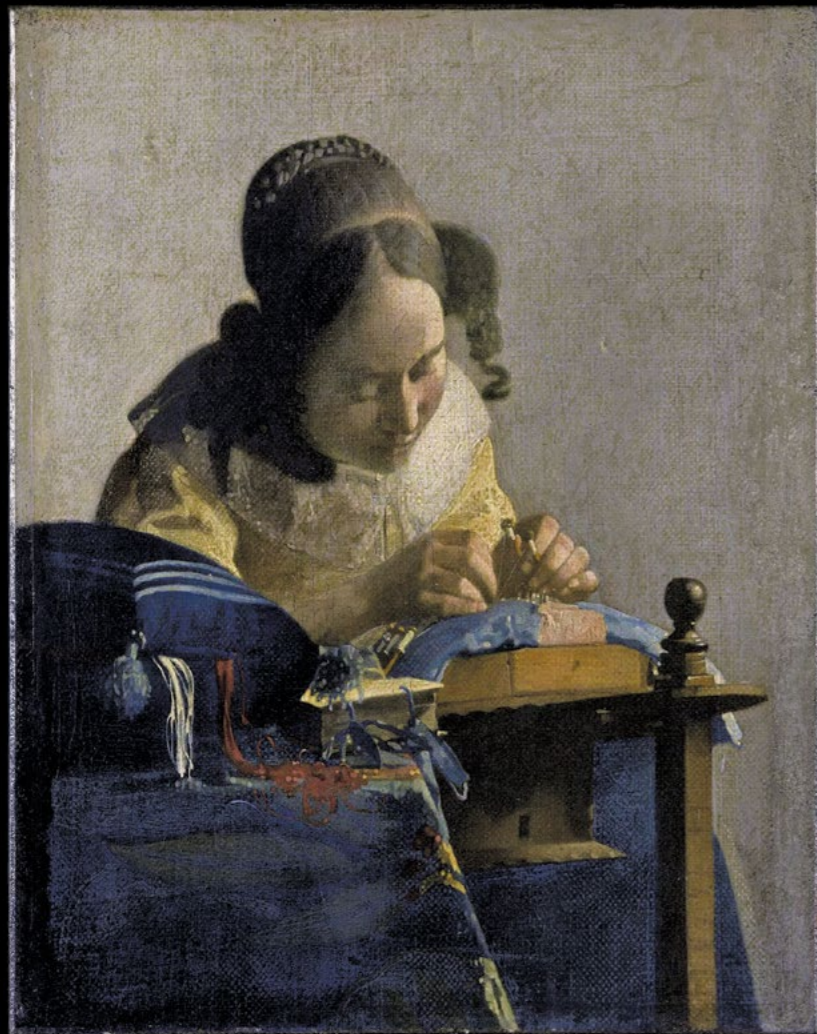
DIE SPITZENKLÖPPLERIN (ca. 1669–1670)